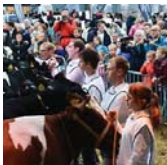
INTANGIBLE HERITAGE Cow Market in Woerden (/en/koeimartwoerden)