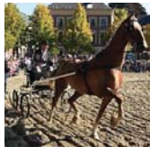
INTANGIBLE HERITAGE Relief of Groningen (/en/groningensontzet)